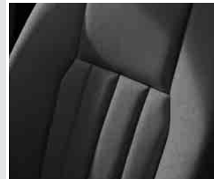
▲ Polsterung Stoff »Edinburgh«