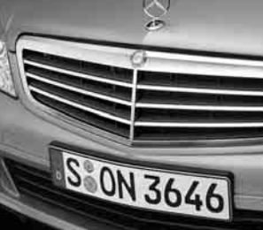
Lufteinlass, schwarze Lamellen ▲