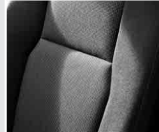
▲ Polsterung Stoff »Brighton«