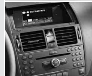
▲ Audio 50 APS