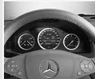
▲ Display im Kombiinstrument