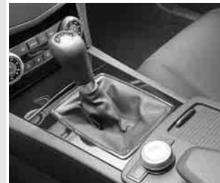
▲ Zierteile in Klavierlack-Optik