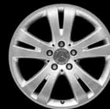
▲ 17" 5-Doppelspeichen-Design