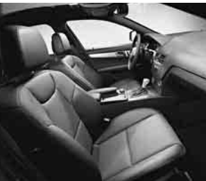
Sportsitze vorne ▲