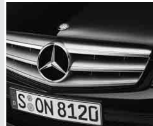
▲ Lamellenkühler mit Stern