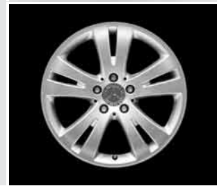
▼ 17" 5-Doppelspeichen-Design