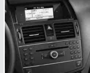
▲ Audio 20 CD

1) in Verbindung mit »CLASSIC«, nur in Verbindung mit Komfort-Multifunktionslederlenkrad, Code 442, und Lenkrad und Schalt-/Wählhebel in Leder, Code 280