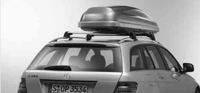
◀ Grundträger New Alustyle, Mercedes-Benz Dachbox