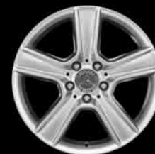
▲ 17" 5-Speichen-Design