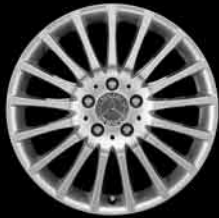
17" Vielspeichen-Design ▲