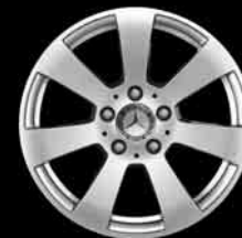
▲ 16" 7-Speichen-Design