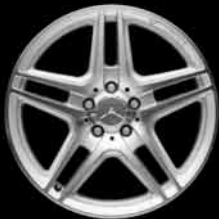
18" AMG 5-Doppelspeichen-Design ▲