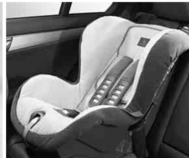
▲ Kindersitz DUO plus