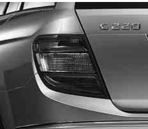
Schlußleuchte in Klarglas ▲