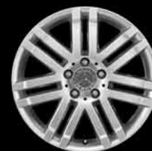
▼ 17" 7-Doppelspeichen-Design