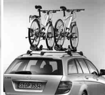
Grundträger New Alustyle, Fahrradhalter New Alustyle ▶