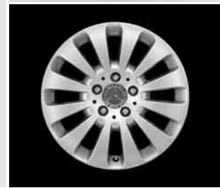
▼ 16" 12-Speichen-Design