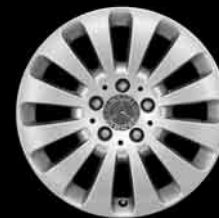
▲ 17" 12-Speichen-Design