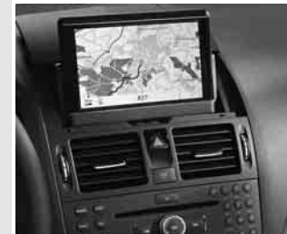
▲ COMAND APS