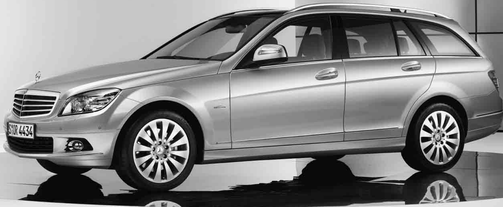
Design- und Ausstattungslinie »ELEGANCE«