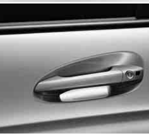
Türgriffe in Wagenfarbe lackiert ▼