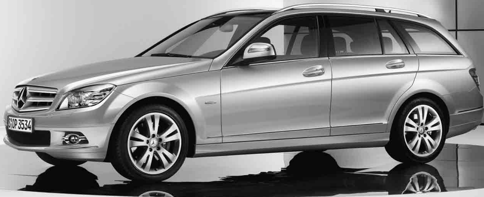
Design- und Ausstattungslinie »AVANTGARDE«