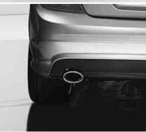
AMG Heckschürze ▼