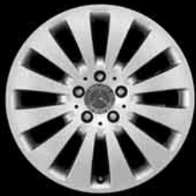
17" 12-Speichen-Design ▲