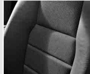
▲ Polsterung »Liverpool«