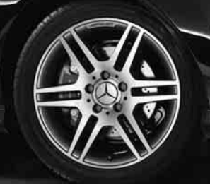
17" AMG 6-Doppelspeichen-Design ▲