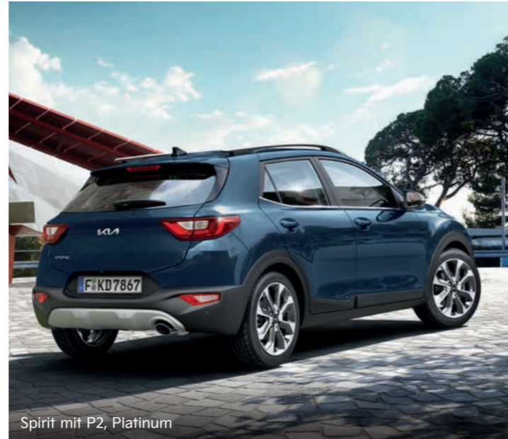
Spirit mit P2, Platinum