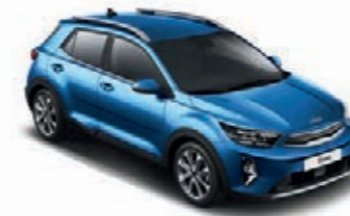
Bathysblau Met. (SPB)