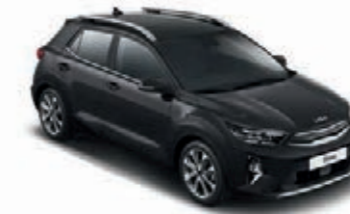
Auroraschwarz Met. (ABP)