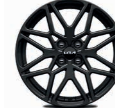
17-Zoll-Leichtmetallfelgen (Nightline Edition)