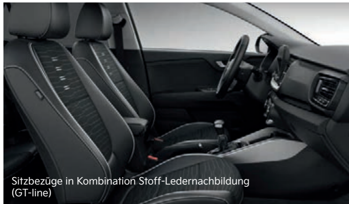
Sitzbezüge in Kombination Stoff-Ledernachbildung (GT-line)