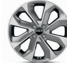
17-Zoll-Leichtmetallfelgen (Spirit und Platinum)