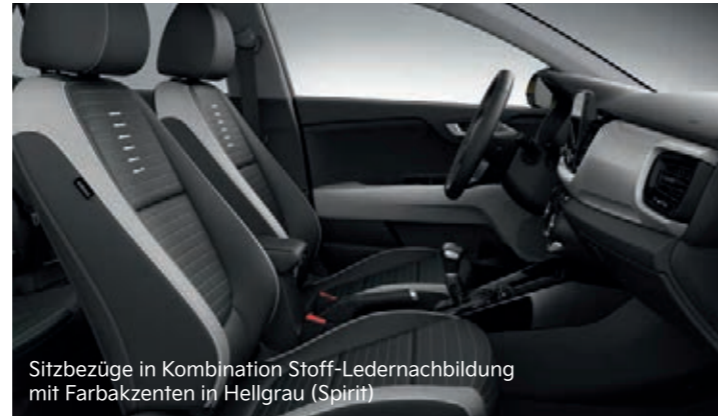
Sitzbezüge in Kombination Stoff-Ledernachbildung mit Farbakzenten in Hellgrau (Spirit)