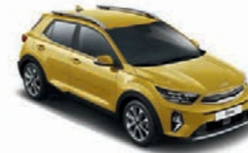
Honey Bee Yellow Met. (B2Y)