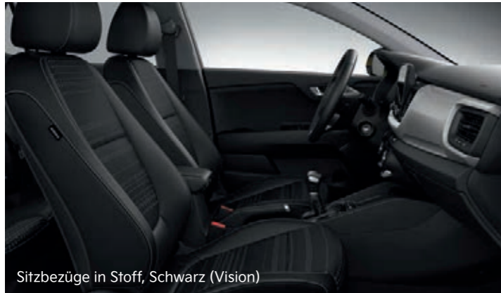
Sitzbezüge in Stoff, Schwarz (Vision)

Hier kannst du dich entspannen: Für den Kia Stonic stehen Sitzbezüge aus Stoff oder Stoff in Kombination mit Ledernachbildung zur Wahl. Die Version Platinum bietet dir Sitze aus hochwertiger Ledernachbildung.