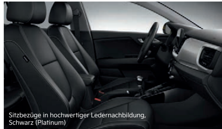
Sitzbezüge in hochwertiger Ledernachbildung, Schwarz (Platinum)