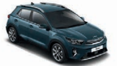
Denimblau Met. (EU3)