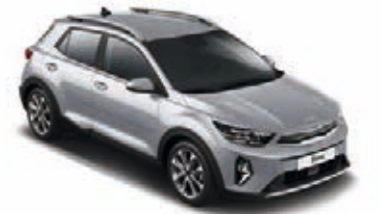
Sparklingsilber Met. (KCS)