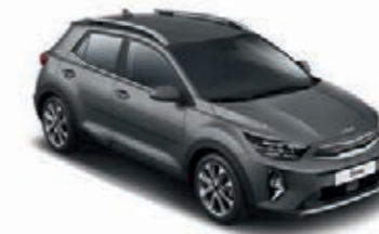
Astrograu Met. (M7G)