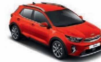
Signalrot Met. (BEG)