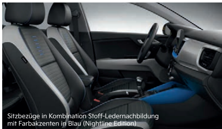
Sitzbezüge in Kombination Stoff-Ledernachbildung mit Farbakzenten in Blau (Nightline Edition)

Abbildungen zeigen kostenpflichtige Sonderausstattung.