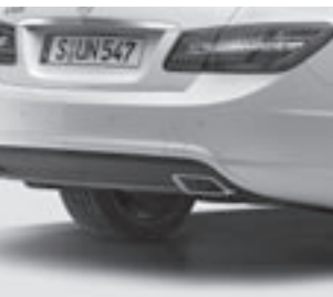
AMG Heckschürze 7)