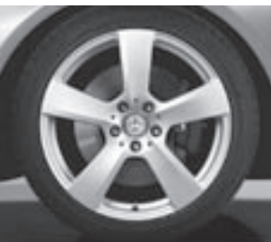
18" 5-Speichen-Design (R32)

* tagesaktuelle Konditionen unter www.mercedes-benz-bank.de (siehe Hinweis auf Seite 4)