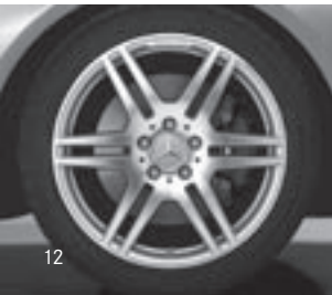
18" AMG 6-Doppelspeichen-Design