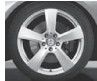
18" 5-Speichen-Design (2R8)