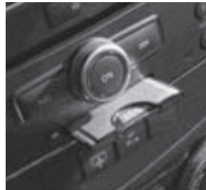
PCMCIA Multi-Card Reader