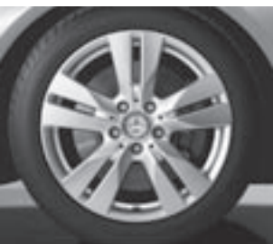
17" 5-Doppelspeichen-Design (R52)