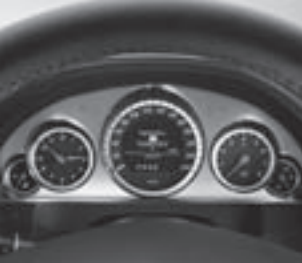
Kombiinstrument in Tubenoptik