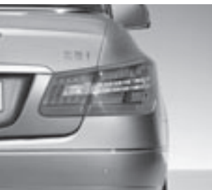
Heckleuchten in LED-Ausführung