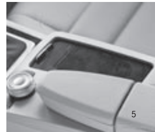
Ablagefach mit Rolloabdeckung