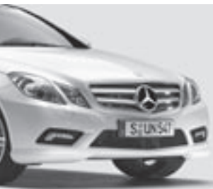
AMG Frontschürze 7)