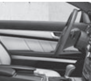
Türmittelfelder in designo Leder