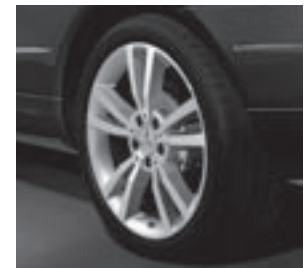
18" Shikrio, 5-Speichen-Design