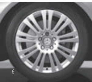
17" 9-Doppelspeichen-Design (31R)