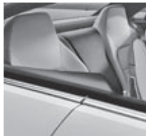
Sitzanlage im Fond