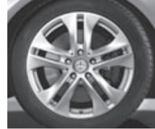
17" 5-Doppelspeichen-Design (1R7)

* tagesaktuelle Konditionen unter www.mercedes-benz-bank.de (siehe Hinweis auf Seite 4)