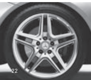
18" AMG 5-Doppelsp.-Design (795)