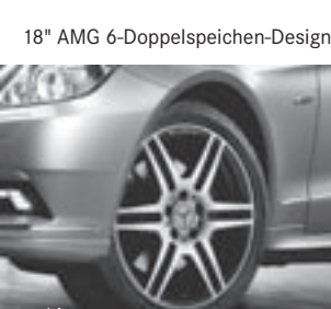
18" AMG 6-Doppelspeichen-Design