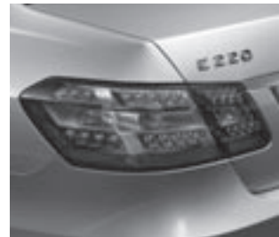
Heckleuchten in LED-Ausführung