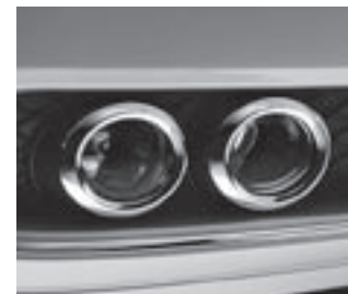
Nebelscheinwerfer und Tagfahrlicht