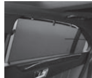
Rollo in den Fondtüren