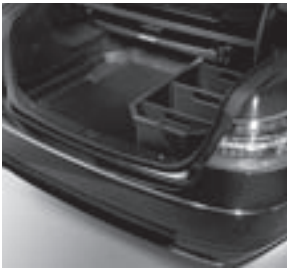
Kofferraumwanne, flach mit Staubbox