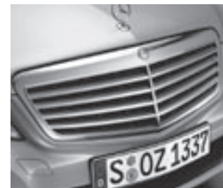
Kühlergrill silber lackiert