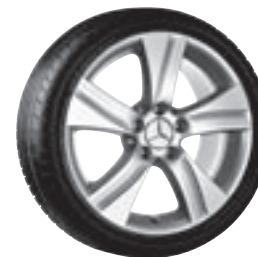
17" Gulshorn, 5-Speichen-Design