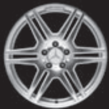
AMG Doppelsp.-Design (781/786)