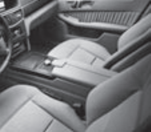
Polsterung Leder Nappa