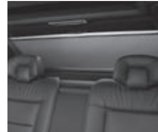
Rollo elektrisch für Heckfenster