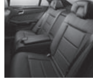
Komfort-Einzelsitze im Fond

Rollo elektrisch für Heckfenster, Rollo mechanisch in den Fondtüren und Komfort-Doppelsonnenblenden (ausziehbar, zweiteilig aufklappbar) mit Make-up Spiegel