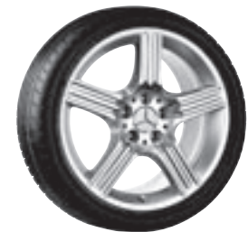
18" Sinnif, 5-Speichen-Design