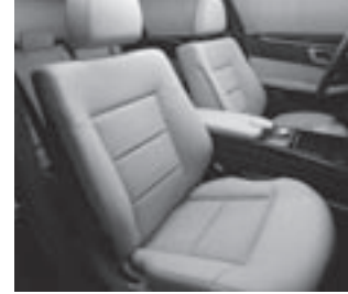
Polsterung Stoff Biarritz/ARTICO

DIRECT CONTROL-Fahrwerk, sportlich abgestimmt und tiefergelegt (E 220 CDI BlueEFFICIENCY – E 350 CDI 4MATIC BlueEFFICIENCY E 250 CGI BlueEFFICIENCY – E 350 4MATIC)