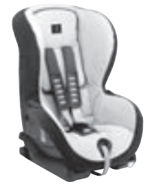
Kindersitz DUO plus