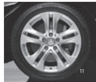
5-Doppelspeichen-Design (R 11)