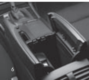
Ablagefach in Mittelkonsole