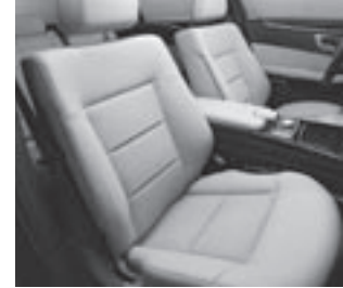
Polsterung Stoff Biarritz/ARTICO