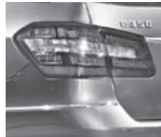
Heckleuchte in LED-Ausführung