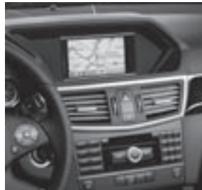
Audio 50 APS