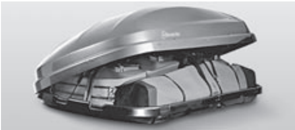
Mercedes-Benz Dachbox, Maßtaschenset für Mercedes-Benz Dachbox