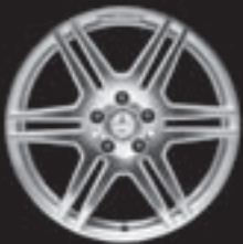
AMG Doppelsp.-Design (781/786)