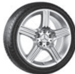
18" Sinnif, 5-Speichen-Design