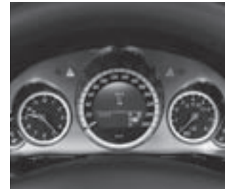
Kombiinstrument in silber