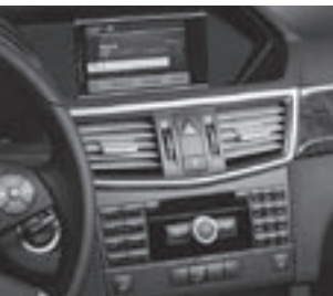
Radio Audio 20 CD