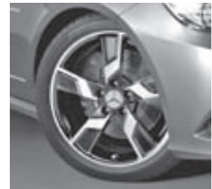
18" Xentres, 5-Speichen-Design