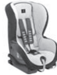
Kindersitz DUO plus