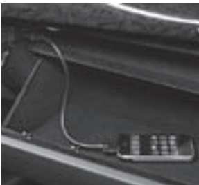
Media Interface 1)