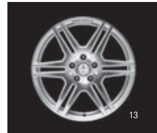
AMG Doppelsp.-Design (781/786)