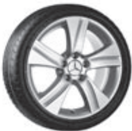
17" Gulshorn, 5-Speichen-Design