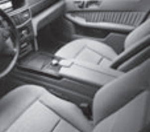
Polsterung Leder Nappa