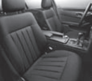
Polsterung Stoff Toulon