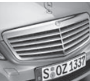
Kühlergrill silber lackiert