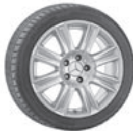
17" Haidea, 8-Speichen-Design