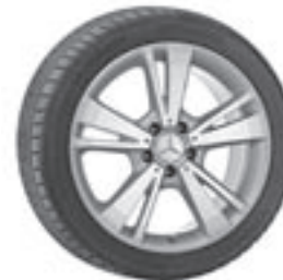
18" Chegra, 5-Doppelspeichen-Design