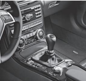
Zierelemente AMG Carbon