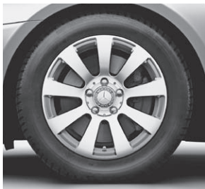
40,6 cm (16") Leichtmetallrad im 9-Speichen-Design (R12)