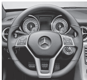
Multifunktionslenkrad im 3-Sp.-Design, unten abgeflacht