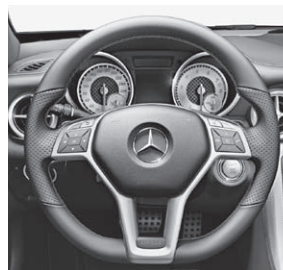
Multifunktions-Sportlenkrad mit Perforation und roter Ziernaht