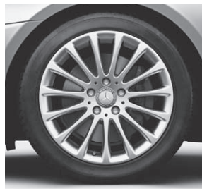
43,2 cm (17") Leichtmetallrad im Vielspeichen-Design (R81)