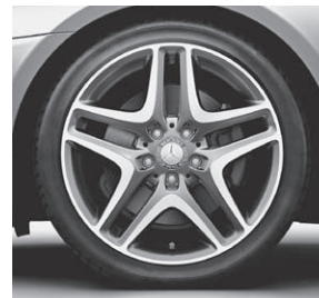
45,7 cm (18") Leichtmetallrad im 5-Doppelspeichen-Design (22R)