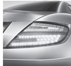
Heckleuchten in LED-Technik