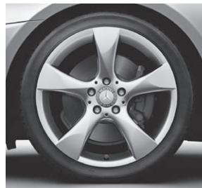
45,7 cm (18") Leichtmetallrad im 5-Speichen-Design (R32)