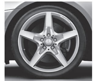
45,7 cm (18") AMG Leichtmetallrad im 5-Speichen-Design (782)