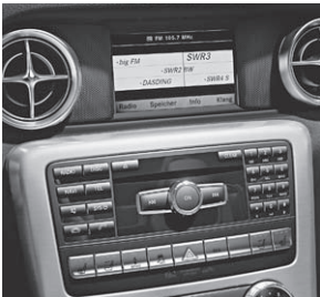
Audio 20 CD