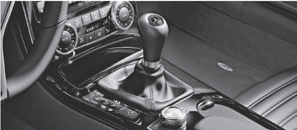
designo Zierelemente in Klavierlack schwarz