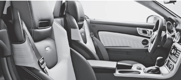
designo Leder Exklusiv zweifarbig