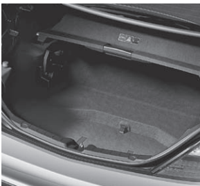
Kofferraum mit Wendeboden