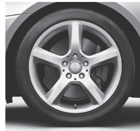
43,2 cm (17") Leichtmetallrad im 5-Speichen-Design (37R) (Serie SLK 250)