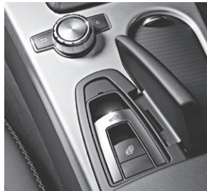
Dach-Bedieneinheit und zentrales Bedienelement