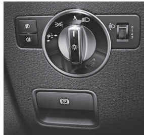
Feststellbremse elektrisch mit Komfortfunktion