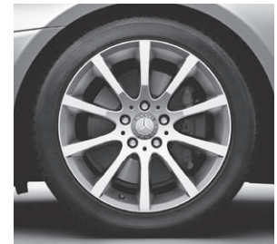
43,2 cm (17") Leichtmetallrad im 10-Speichen-Design (R35) (Serie SLK 350)