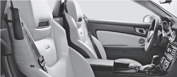
designo Leder Exklusiv einfarbig