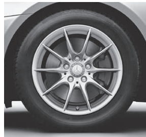
40,6 cm (16") Leichtmetallrad im 10-Speichen-Design (39R) (Serie SLK 200)