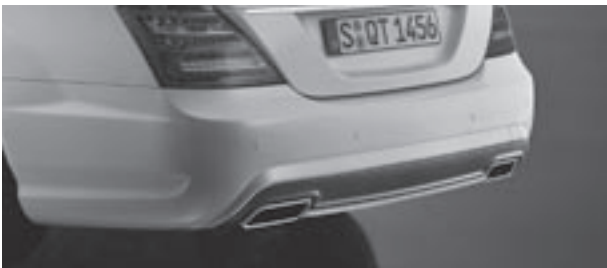
Heckschürze in AMG Styling