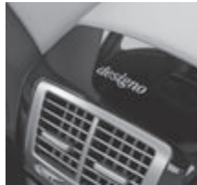
designo Logo in 18 Karat Gold