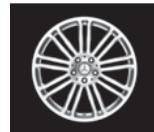
9-Doppelsp.-Design 19" (R85/R94)