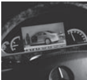
Nachtsicht-Assistent PLUS mit Personenerkennung