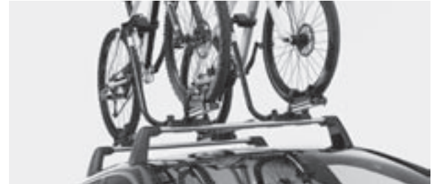
Grundträger New Alustyle, Fahrradträger New Alustyle