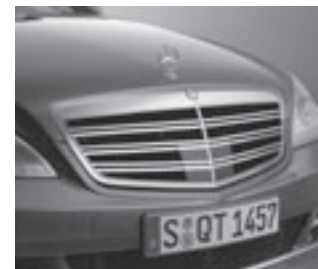
Kühlergrill mit Doppellamellen