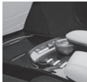
Zierteile Klavierlack designo schwarz