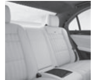
Fondsitzeanlage designo Anilinleder Exklusiv einfarbig