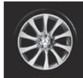
20" Alaraph, 10-Speichen-Design