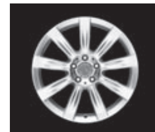
9-Speichen-Design 18" (R91/R92)