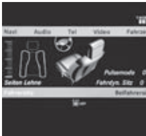
Aktiv-Multikontursitze vorne mit Massage- und Fahrdynamikfunktion