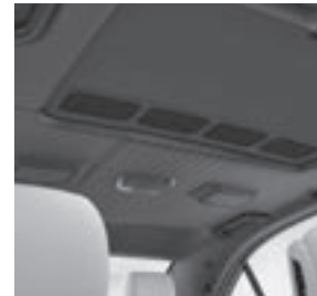
designo Innenhimmel Leder Nappa schwarz