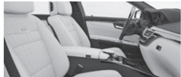
designo Anilinleder Exklusiv einfarbig