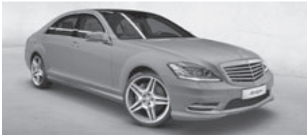
Lackierung designo magno platin