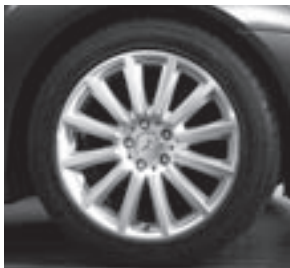
18" Maedis, 12-Speichen-Design