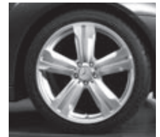
20" Kiyali, 5-Speichen-Design