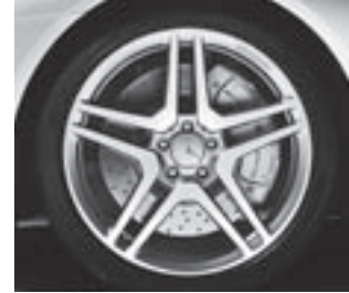
AMG Schmiederad 20" (783)

* tagesaktuelle Konditionen unter www.mercedes-benz-bank.de (siehe Hinweis auf Seite 4)