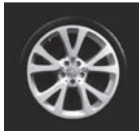
19" Nuklida, 5-Y-Speichen-Design