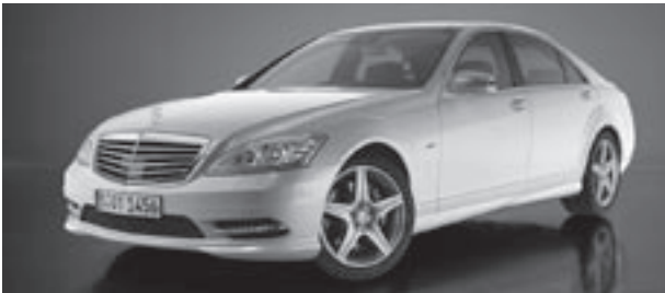
Frontschürze in AMG Styling