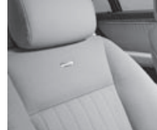
Sitz im V12-Pfeifen-Design

Media Interface: universelle Schnittstelle im Handschuhfach inkl. Kabel (für iPod, USB und Aux) für diverse mobile Audio-Geräte