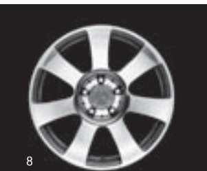
7-Speichen-Design 17" (R44)