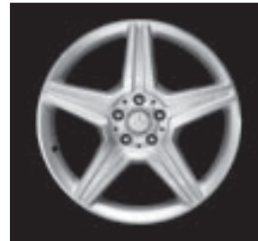
19" AMG LM-Rad im 5-Speichen-Design (770/780)