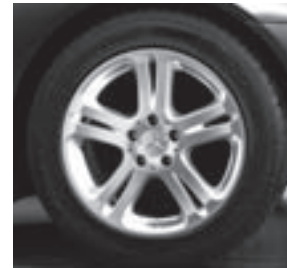
17" Almach, 5-Doppelspeichen-Design