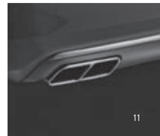
Verchromte Endrohre mit Steg