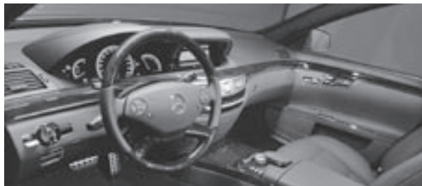
Holz-Leder-Lenkrad und Zierteile in Esche schwarz