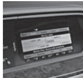
COMAND-Display mit SPLITVIEW