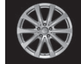
10-Speichen-Design 18" (R71/R41)