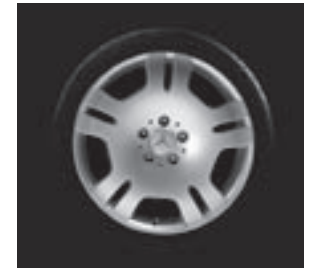
18" Eridanus, 5-Doppelspeichen-Design