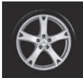
19" Almizar, 5-Speichen-Design