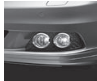
Tagfahrlicht und Nebelscheinwerfer