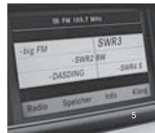
Audio 20 Radio CD Display