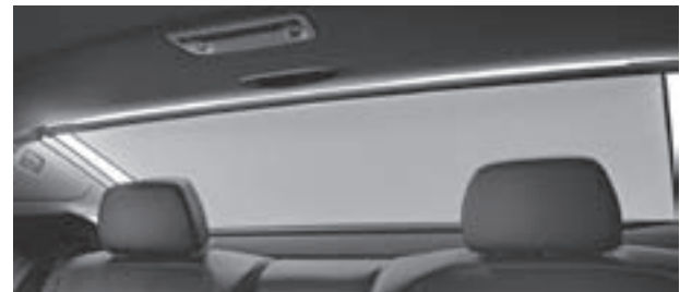
Rollo elektrisch für Heckfenster