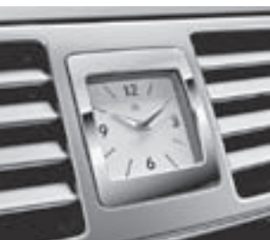
Instrumententafel mit Analoguhr