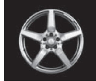
AMG 5-Speichen-Design (770)