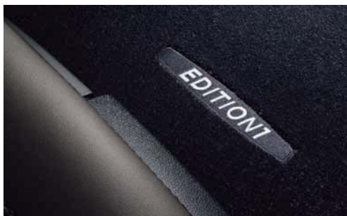
Die exklusiven Fußmatten tragen den Schriftzug der Edition.