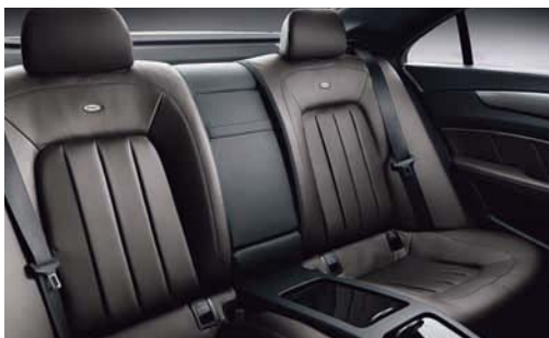
Der Fond zeigt sich in edler designo Polsterung Leder corteccia pearl.

* Leasing-Sonderzahlung 20 %, Laufzeit 36 Monate, Gesamtleistung 60.000 km. Berechnung der Monatsraten für die Sonderausstattungen auf Basis eines CLS 350 CDI BlueEFFICIENCY, Stand 08/10. Dies ist ein Angebot der Mercedes-Benz Leasing GmbH und basiert auf den derzeitigen Kapitalmarktzinsen. Es ist freibleibend und verpflichtet keine Seite zum Vertragsabschluss. Tagesaktuelle Konditionen erhalten Sie unter www.mercedes-benz-bank.de oder bei Ihrem Verkaufsberater. Dieser erstellt Ihnen gern ein individuelles Angebot.