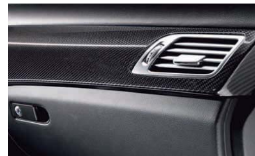
Die optional erhältlichen Zierelemente AMG Carbon.