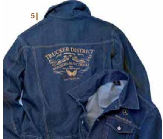
5| BESTICKTE JEANSJACKE Dark stone washed, 100 % Baumwolle, mehrfarbige Stickerei, Used-Effekt. S-XXXL (B6 787 1866-1871) | 59,90