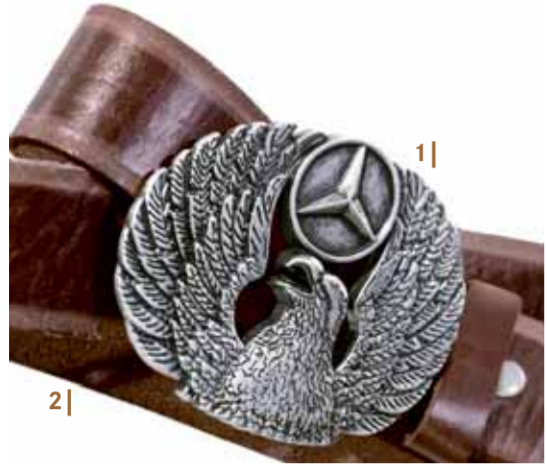
1| GÜRTELSCHLESSE Antiksilber, lim. Auflage von 999 St., auf der Rückseite durchnummeriert, passend zu Ledergürtel B6 787 6146. (B6 787 4203) | 35,00