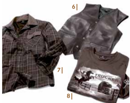
6| TRUCKER WESTE Dunkelbraun, 100 % Leder, Futterstoff: 100 % Polyamid. S-XXXL (B6 787 9426-9431) | 119,90