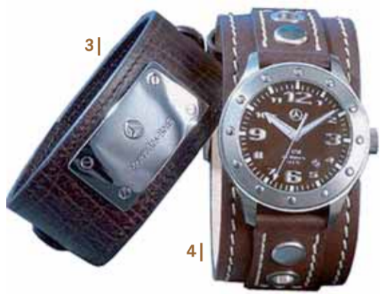
3| LEDERARM BAND Dunkelbraun, silberfarbene Nieten, 100 % geprägtes Rindsleder, „TRUCKER“-Prägung am Verschlussband, längenverstellbar, Logogravur. (B6 787 4202) | 29,90