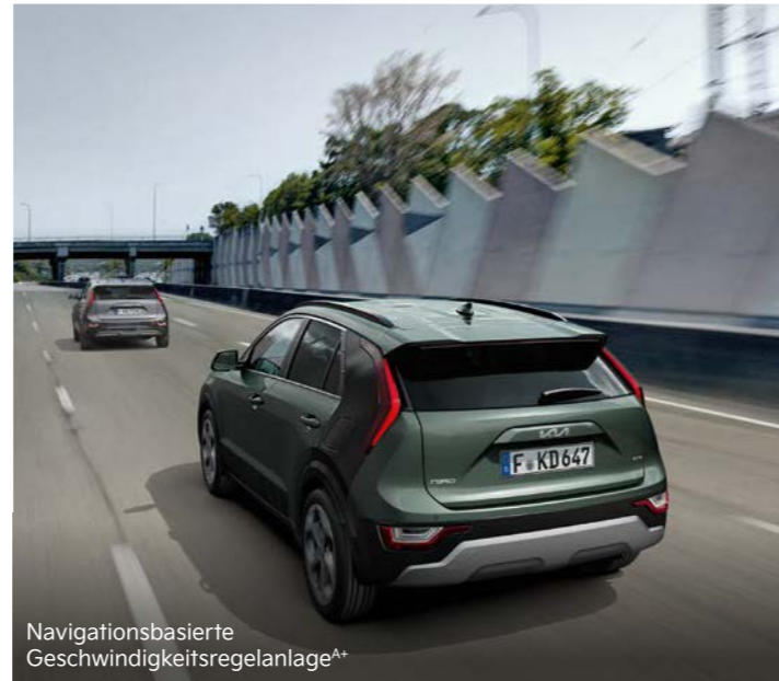
Navigationsbasierte Geschwindigkeitsregelanlage A+

Kia Niro Plug-in Hybrid: Kraftstoffverbrauch, kombiniert (l/100 km) 1,6; Stromverbrauch, kombiniert (kWh/100 km) 13,0. CO 2 -Emission, kombiniert (g/km): 36; Effizienzklasse: A+++.