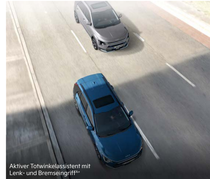
Aktiver Totwinkelassistent mit Lenk- und Bremsengriff A+

Der serienmäßige aktive Spurhalteassistent (Lane Keep Assist, LKA) behält per Kamera ständig die Fahrbahnmarkierungen im Blick. Bei einem unbeabsichtigten Verlassen der Fahrspur warnt er dich und lenkt zugleich geringfügig gegen, um das Fahrzeug in der Spur zu halten (ohne Abbildung).