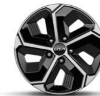
16-Zoll-Leichtmetallfelgen (Serie für Edition 7 und Vision)

Bei einigen unserer modernen Metallicfarben werden bewusst unterschiedliche Farbpigmente verwendet. Dadurch können unter bestimmten Lichtverhältnissen, z. B. direktes Sonnenlicht, attraktive Farbeffekte erzielt werden. Zum Teil kann die Farbe changieren, z. B. von Schwarz zu Dunkelblau. Bei den hier abgebildeten Farbdarstellungen kann es aufgrund der Drucktechnik zu Abweichungen zu den Originalfarben kommen. Weitere Informationen zu den Farbeffekten und Grundfarben erhältst du bei deinem Kia-Partner. Metalliclackierungen sind aufpreispflichtig.