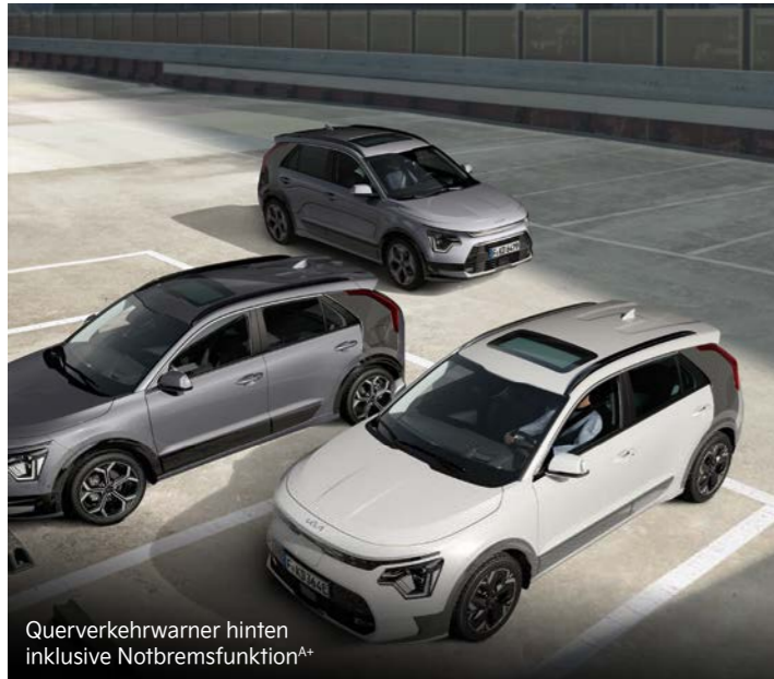
Querverkehrswarner hinten inklusive Notbremsfunktion A+

Mit einem breiten Spektrum an aktiven Sicherheitssystemen A unterstützt dich der Kia Niro dabei, in Gefahrensituationen schnell und angemessen zu reagieren.