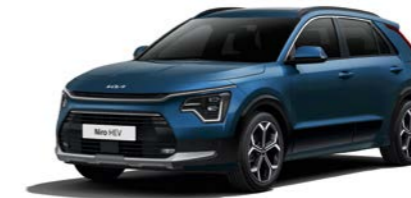
Mineralblau Metallic (M4B)