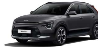
Interstellar Grau Metallic (AGT)