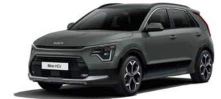
Cityscape Grün Metallic (CGE)