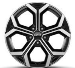
18-Zoll-Leichtmetallfelgen (Serie für Spirit)

Detaillierte Informationen zum Kia Niro Hybrid und Kia Niro Plug-in Hybrid findest du unter www.kia.com/de/broschuere . Dort kannst du dir auch die komplette Modellbroschüre herunterladen.