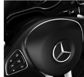
7G-TRONIC PLUS inklusive TEMPOMAT, DIRECT SELECT Wählhebel, Lenkradschalt paddles und DYNAMIC SELECT

V-Klasse AVANTGARDE (VQ1) (Auszug zusätzliche Serienumfänge ggü. V-Klasse)