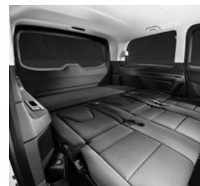
Liege-Paket inklusive 3er-Sitzbank als Komfortliege in der 2. Reihe (V9B)