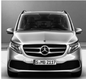
Sportfahrwerk (CF8) (Optional: AGILITY CONTROL Fahrwerk [CA1])