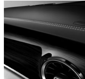
Instrumententafel in Lederoptik mit Ziernaht