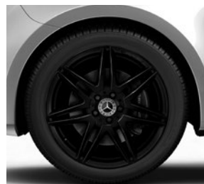
48,3 cm (19") AMG-Leichtmetall- räder, schwarz, mit Bereifung 245/45 R 19 (R1U)