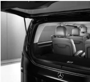
Separat zu öffnende Heckscheibe (W64)

V-Klasse AVANTGARDE (VQ1) (Auszug zusätzliche Serienumfänge ggü. V-Klasse)