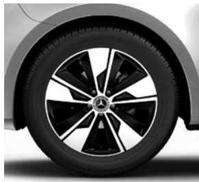
45,7 cm (18") Leichtmetallräder, schwarz, glanzgedreht, mit Bereifung 245/45 R 18 (R1P)