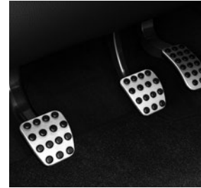
Sportpedale in Aluminium gebürstet (YF3)