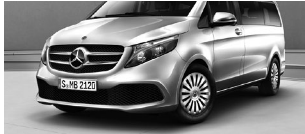
2-Lamellen-Kühlerverkleidung in Silber glänzend