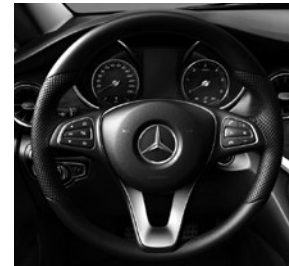
Multifunktionslenkrad im 3-Speichen-Design