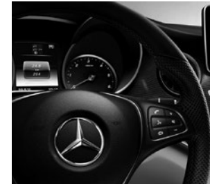
Multifunktionslenkrad Leder Nappa (CL3)