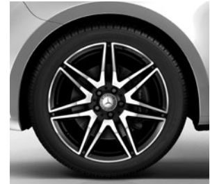
48,3 cm (19") AMG Leichtmetallräder im 7-Doppelspeichen-Design, schwarz glanzgedreht (RK4)