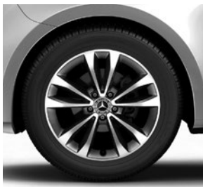
45,7 cm (18") Leichtmetallräder, tremolitgrau, glanzgedreht, mit Bereifung 245/45 R 18 (R10)