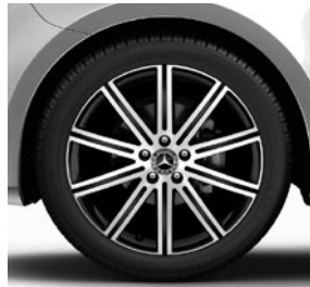
48,3 cm (19") Leichtmetallräder, 10-Speichen-Design, schwarz, glanzgedreht, mit Bereifung 245/45 R 19 (R1Q) 2)