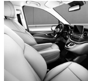
Leder Lugano (VX7/VX9), Ziirelement Doppelstreifenoptik (F2Z)