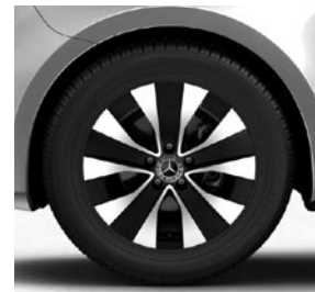
43,2 cm (17") Leichtmetallräder, schwarz, glanzgedreht, mit Bereifung 225/55 R 17 (R1N)