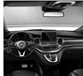
Zierelemente Carbonoptik (FB1) und Sportpedalanlage (YF3)