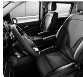
Polsterung Stoff Santos