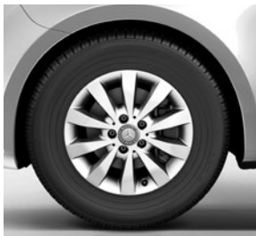
40,6 cm (16") Leichtmetallräder, vanadiumsilber lackiert, mit Bereifung 205/65 R 16 (RL5) 1)