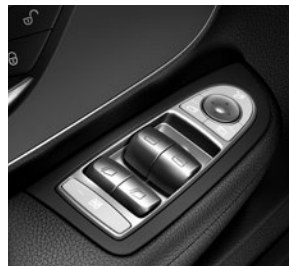
Fensterheber elektrisch 2-fach (mit Sonderausstattung 4-fach)