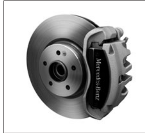
43,2 cm (17") Bremsanlage an der Vorderachse und Bremssättel mit „Mercedes-Benz“ Schriftzug