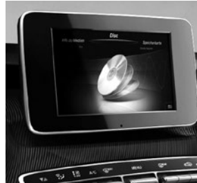
Audio 20 CD mit Touchpad (EA1)