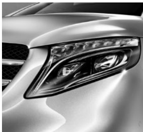
LED Intelligent Light System (LG2 + LG4)