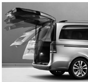
EASY-PACK Heckklappe (W68)