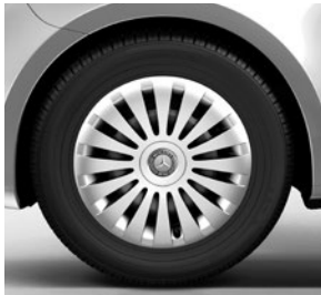
40,6 cm (16") Stahlräder mit Radvollabdeckung, mit 195/65 R 16 auf 6,5 J x 16 ET 52