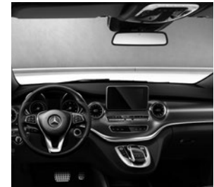
Zierelement Klavierlackoptik schwarz glänzend