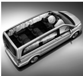
Windowbags für Fahrer, Beifahrer und im Fond (SH8)