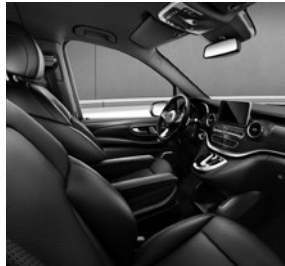
Komfortsitze mit Ziernaht in Leder Nappa in den Farben Schwarz, Seidenbeige oder Tartufo (VY7/V4T/VY9)