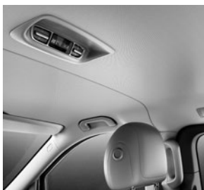
Klimatisierungsautomatik THERMOTRONIC (HH4) und Klima- automatik TEMPMATIC im Fond (HZ7)