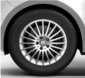
Sport-Paket Exterieur u. a. 43,2 cm (17") Leichtmetallrädern im 20-Speichen-Design, vanadiumsilber lackiert, mit Bereifung 225/55 R 17 (RK8)

V-Klasse EDITION (ZH7) (Auszug zusätzliche Serienumfänge ggü. V-Klasse)