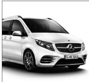
AMG Frontschürze und AMG Seitenschwellerverkleidungen