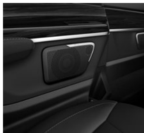
Burmester® Surround-Soundsystem (E65)