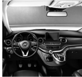
Zierelement Doppelstreifenoptik (F2Z)