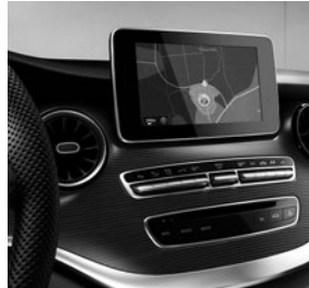
COMAND Online (EJ9) mit Verkehrszeichen-Assistenten (JA9) und Burmester® Surround-Soundsystem (E65)