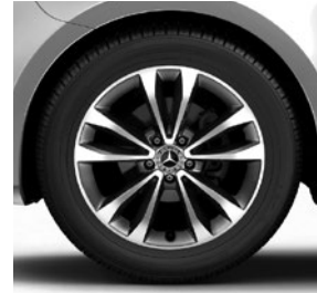
45,7 cm (18") Leichtmetallräder, 5-Doppelspeichen-Design, tremolitgrau, glanzgedreht, Bereifung 245/45 R 18 (R10)