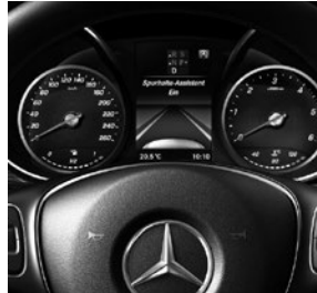
Spur-Paket (JP4) mit Totwinkel- (JA7) und Spurhalte-Assistent (JW5)