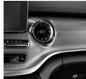
Zierelemente in gebürstetem Aluminium (FB2)