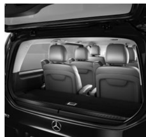
Separat zu öffnende Heckscheibe (W64) und Laderaumunterteilung (YG4)