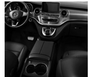
Mittelkonsole mit Kühlfach (FG6)