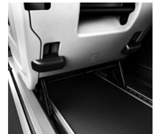
Sitzschienensystem mit Schnellverriegelung zum Ein- und Ausbau der Fondsitze