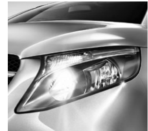
Reflexionsscheinwerfer mit Tagfahrlicht