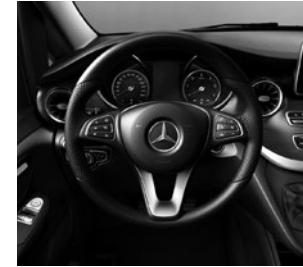
Multifunktionslenkrad Leder Nappa (CL3)