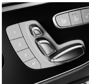
Fahrer- und Beifahrersitz elektrisch einstellbar (SF1/SF2)