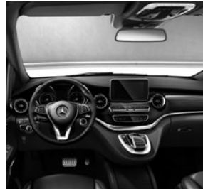
Zierelemente Holzoptik Ebenholz Dunkelanthrazit