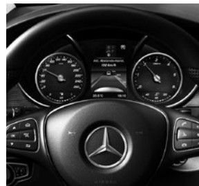
Active Distance Assist DISTRONIC (ET4)