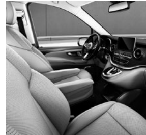
Leder Lugano (VX7/VX9), Zierelemente Doppelstreifenoptik (F2Z)

V-Klasse EXCLUSIVE (VQ8) und EXCLUSIVE EDITION (Z9G) (Auszug zusätzliche Serienumfänge ggü. V-Klasse AVANTGARDE EDITION [ZH8])