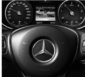
Fahrassistenz-Paket (JP2) mit u. a. Aktivem Brems-Assistenten (BA3) und PRE-SAFE® System (JP1)