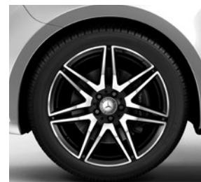
48,3 cm (19") AMG-Leichtmetall- räder, schwarz, glanzgedreht, mit Bereifung 245/45 R 19 (RK4)