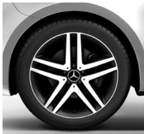
48,3 cm (19") Leichtmetallräder, schwarz lackiert, Front glanzgedreht, mit Bereifung 245/45 R 19 (RL3)