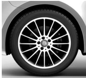
48,3 cm (19") Leichtmetallräder im 16-Speichen-Design, mit Bereifung 245/45 R 19 (RK3) 1)