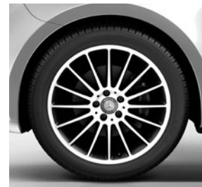
48,3 cm (19") Leichtmetallräder, schwarz lackiert, Front glanzgedreht, mit Bereifung 245/45 R 19 (RK3)