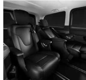
Luxussitze in Liegestellung