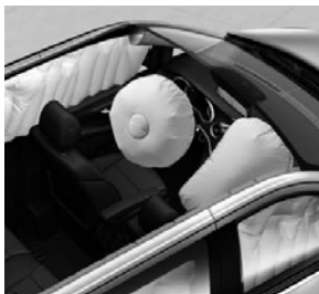
Airbags, Thorax-Pelvis-Sidebags und Windowbags für Fahrer und Beifahrer