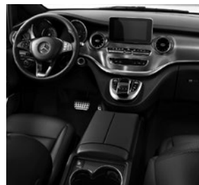
Mittelkonsole mit Kühlfach (FG6)