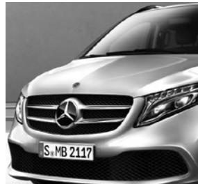
LED Intelligent Light System (LG2 + LG4)