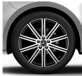
48,3 cm (19") Leichtmetallräder, schwarz, glanzgedreht, mit Bereifung 245/45 R 19 (R1Q)