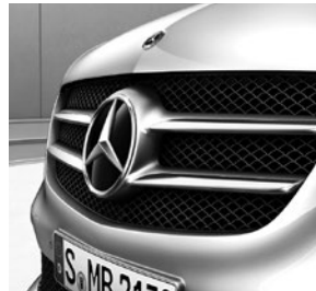
Lufteinlass mit Mercedes Stern