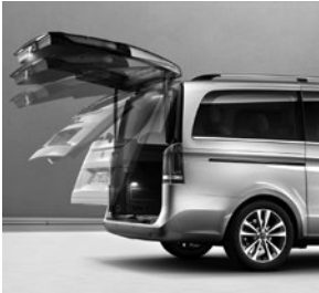
EASY-PACK Heckklappe elektrisch (W68)

V-Klasse AVANTGARDE EDITION (ZH8) (Auszug zusätzliche Serienumfänge ggü. V-Klasse AVANTGARDE [VQ1])