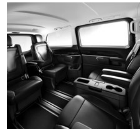
4 Einzelsitze im Fond