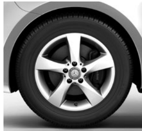
43,2 cm (17") Leichtmetallräder im 5-Speichen-Design, mit Bereifung 225/55 R 17 (RL8)