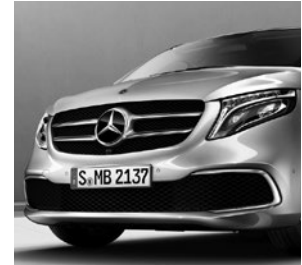
Chromzierstab im Stoßfänger