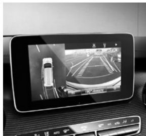
Park-Paket mit 360°-Kamera (EZ6)