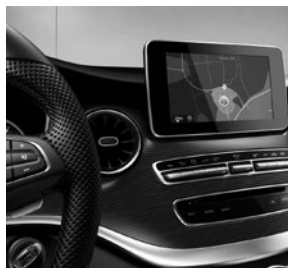
COMAND Online (EJ9)