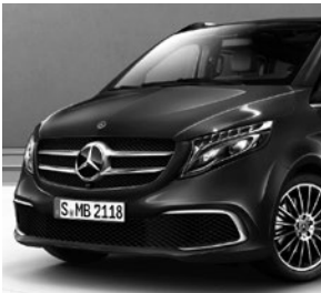
Chromzierstab im vorderen Stoßfänger

V-Klasse EXCLUSIVE (VQ8) und EXCLUSIVE EDITION (Z9G) (Auszug zusätzliche Serienumfänge ggü. V-Klasse AVANTGARDE EDITION [ZH8])