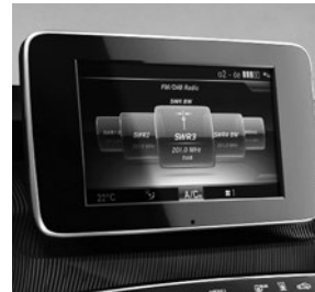
Radio Audio 20 USB