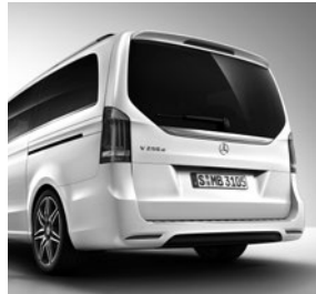
AMG Heckschürze 1) und AMG Abrisskante (FB4)