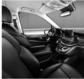
Komfortsitze in Leder Lugano in der Farbe Schwarz